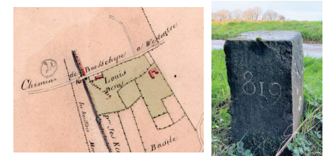
Grenspaal 1819 aan de Boeschepestraat, op het terrein en op de officiële kaart

erfgoed veilig stellen voor de toekomst. Enkele grenspalen zijn voorlopig weggenomen omdat ze los lagen of stuk zijn. Onder het toezien van een Frans-Belgische grenscommissie zullen ze op duurzame wijze worden teruggeplaatst.