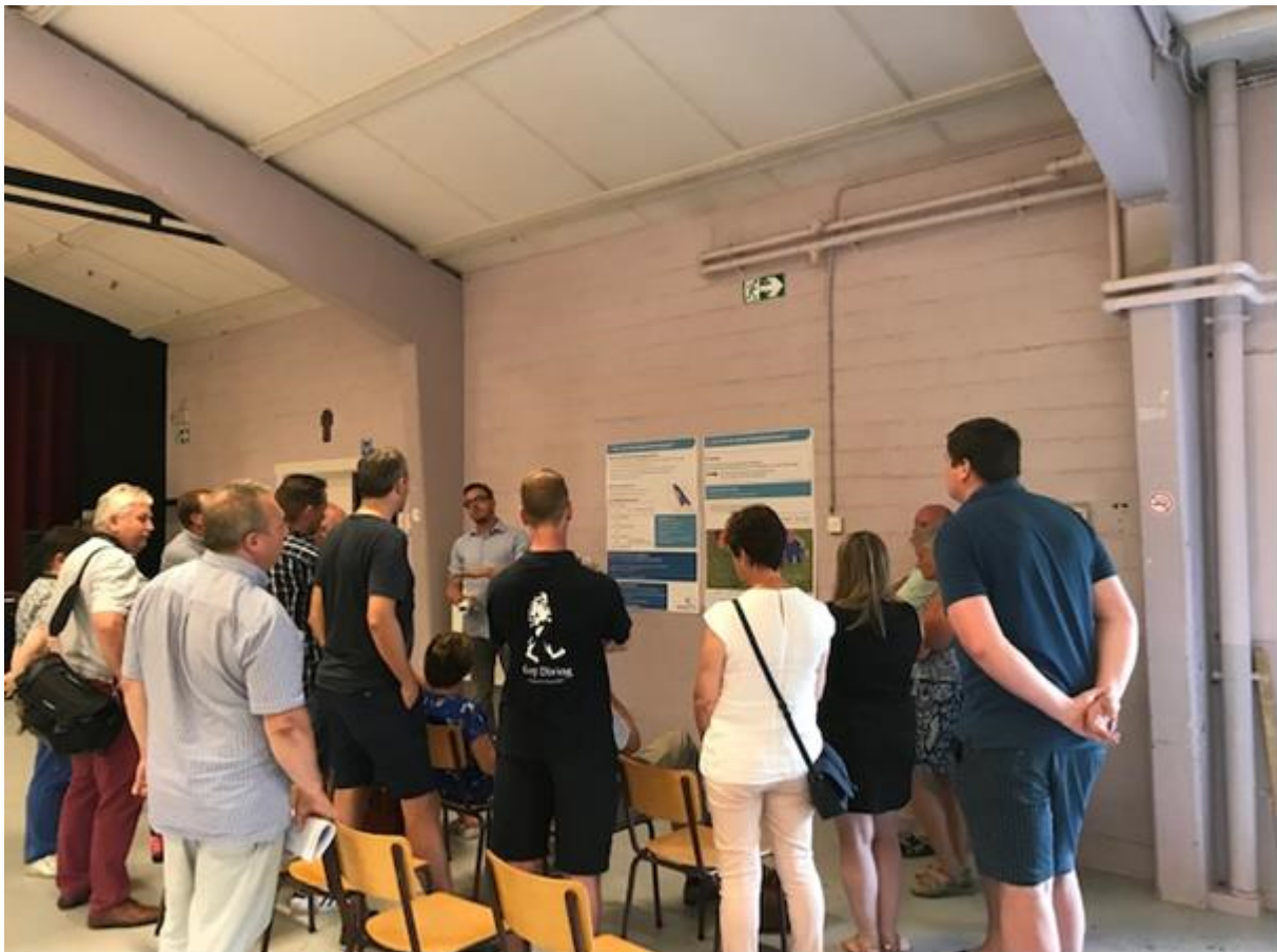
Impressie van de infomarkt

De startnota wordt op basis van alle reacties en opmerkingen verwerkt tot een scopingsnota. De scopingsnota geeft aan op welke wijze er met de informatie is omgegaan en deelt het resultaat ervan mee. De scopingsnota wordt alsook gepubliceerd op de gemeentelijke website.