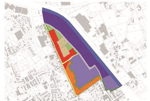
Voorbeeld van een grafisch plan