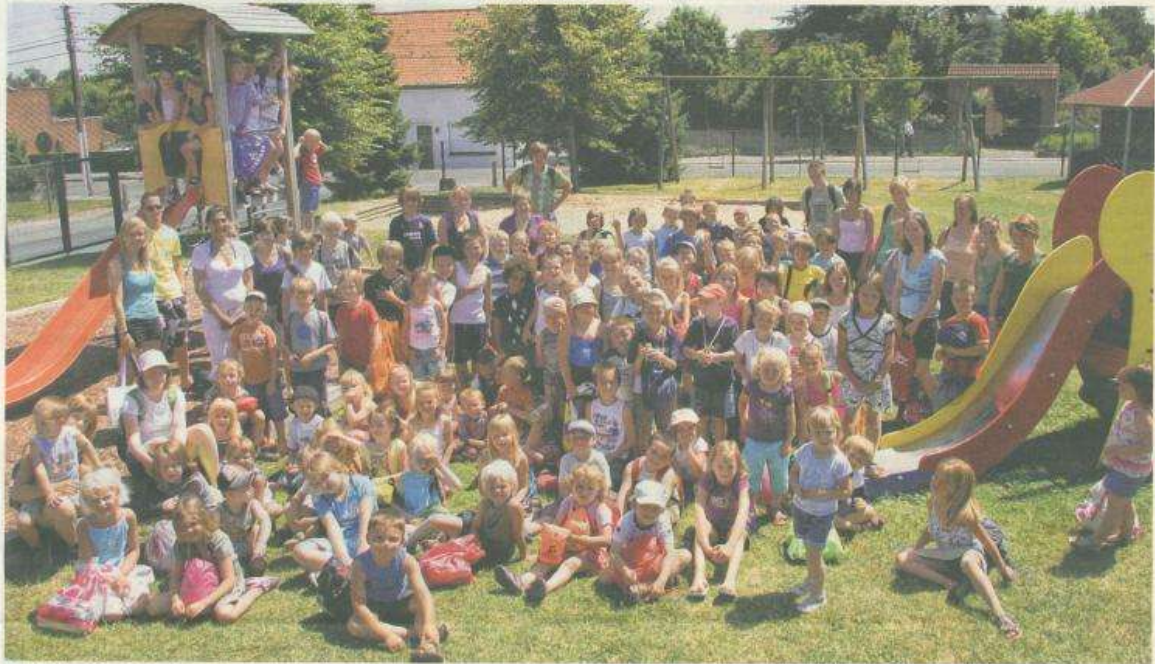
Speelpleinwerking De Bergbengels telt vier speelpleinen en bestaat al meer dan twintig jaar.